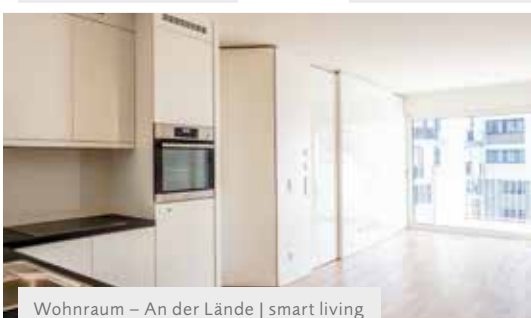
Wohnraum – An der Lände | smart living