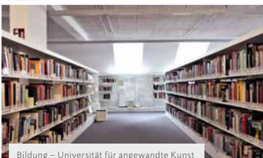
Bildung – Universität für angewandte Kunst