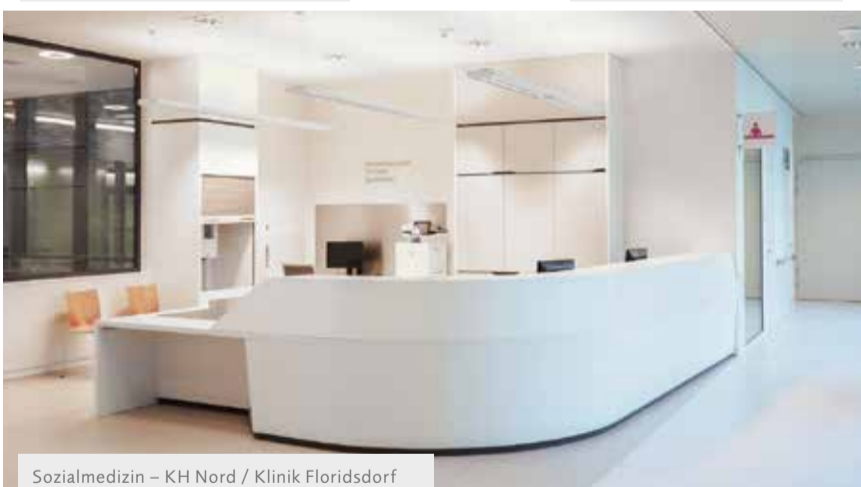
Sozialmedizin – KH Nord / Klinik Floridsdorf