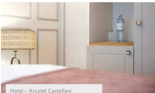
Hotel – Arcotel Castellani